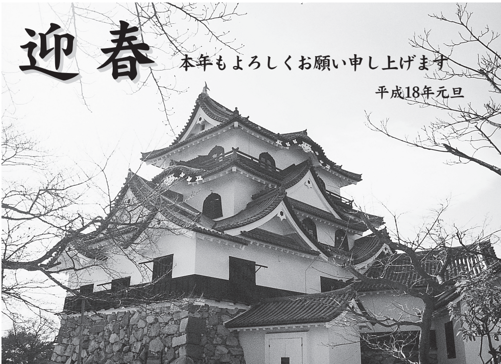
初日をあびる彦根城