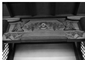
キリスト教ゆかりの模様