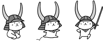
【ひこにゃん 彦根市承認No.389】井伊直弼と開国150年祭