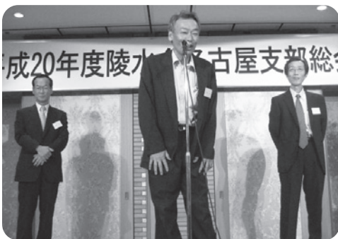
来年度 幹事の皆さん