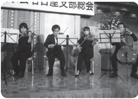
滋賀大オーケストラ