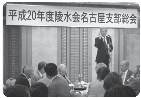
大森新理事長挨拶