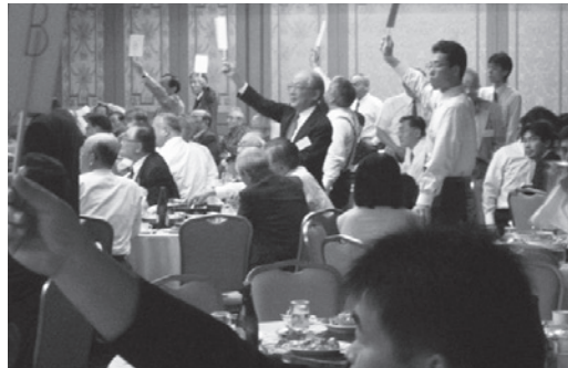
一斉に答をあげる

平成20年度陵水会総会のメインイベントとして大学21回卒業幹事が集まって企画したのが、今、流行の検定クイズでした。名付けて「陵水会名古屋支部彦根検定クイズ」でした。この企画を成功させるためにインターネット等で彦根検定を調べたりしましたが何か既製品のように面白みがありません。やはり、現地を訪ねて実際に自分の目で見て問題を作成しなければ生きた問題は作れません。幹事一同が多忙な中、やっと4名が時間