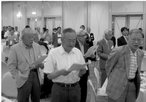
琵琶湖周航の歌大合唱