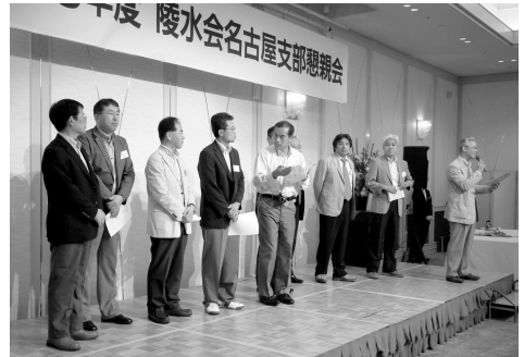
来年への決意表明