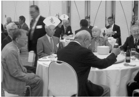
歓談する先輩たち