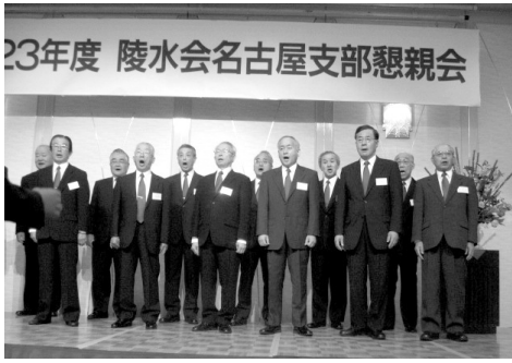
スタート・男声合唱団