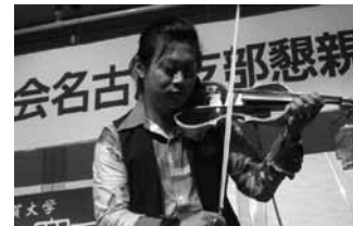
電子ヴァイオリン演奏