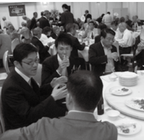
歓談する現役とOBたち