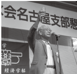
倉坪副支部長による乾杯