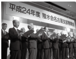
男声合唱団のコーラス